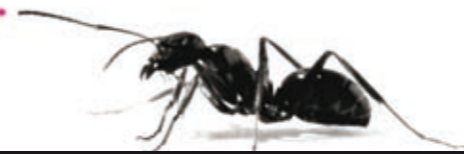
Illustrazione Giulia Cometti