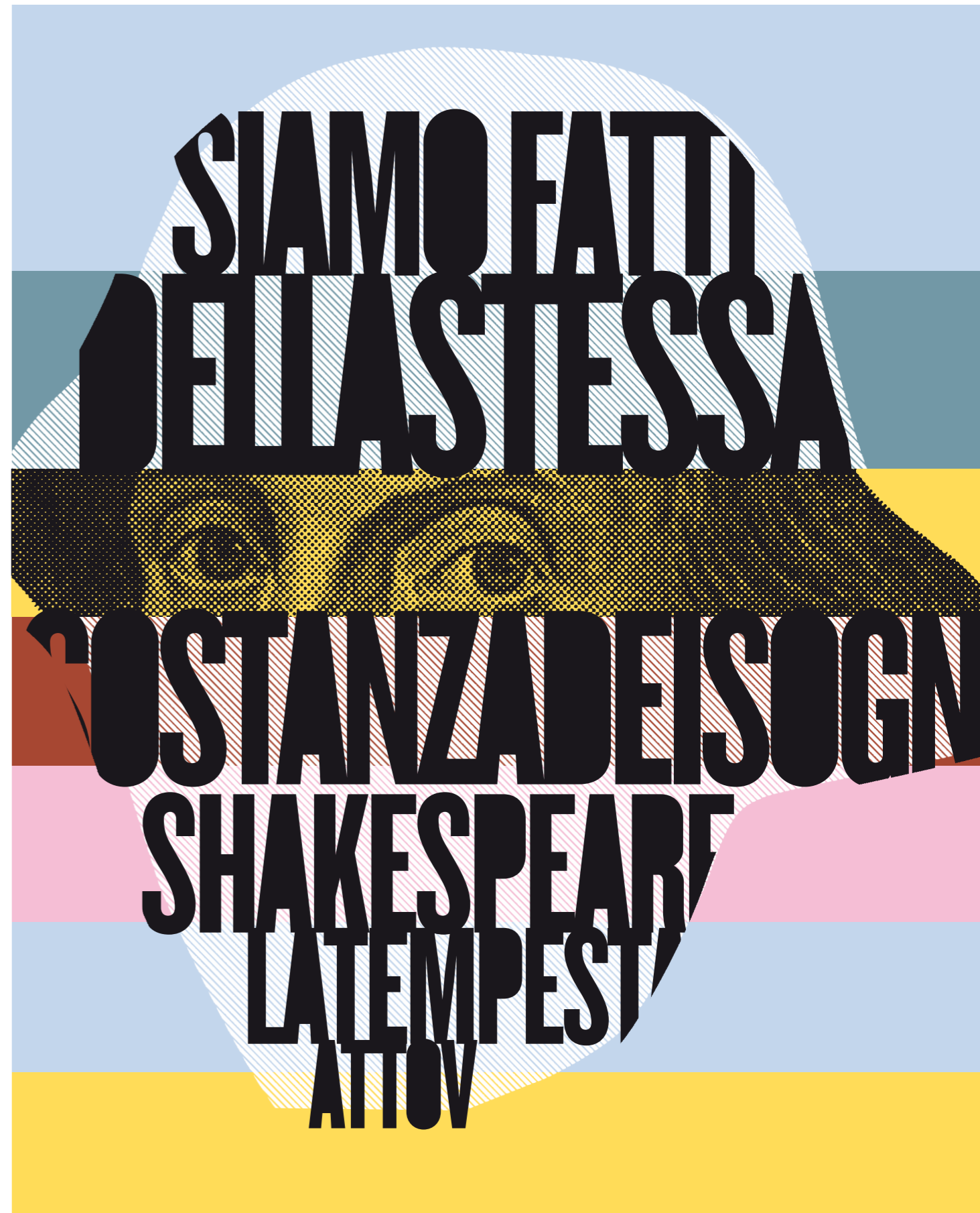
Illustrazione: Simone Ronzio

Realizza la copertina di Ouverture, scopri come su ouvertureweb.it